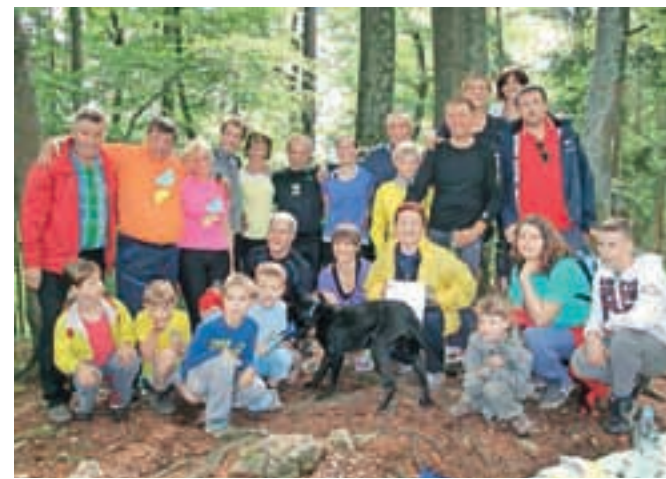
Udeleženci teka na vrhu Vovarja

Izmučene, a zadovoljne tekače so na vrhu z bučno podporo pozdravili zvesti navijači, ki so vse navzoče pogostili z dobrotami iz svojih nahrbtnikov. Po vpisu rezultatov v vpisno knjigo in skupinskem slikanju je sledilo druženje z razglasitvijo rezultatov in drugimi športnimi aktivnostmi.