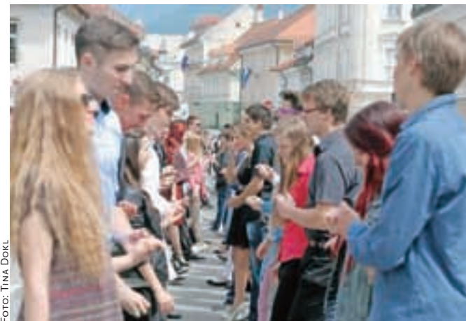
Maturanti so takole zaplesali tradicionalno četvorko.