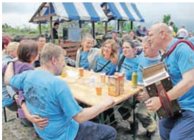
Udeleženci čistilne akcije so si po koncu dela privoščili tudi zaslužno malico.