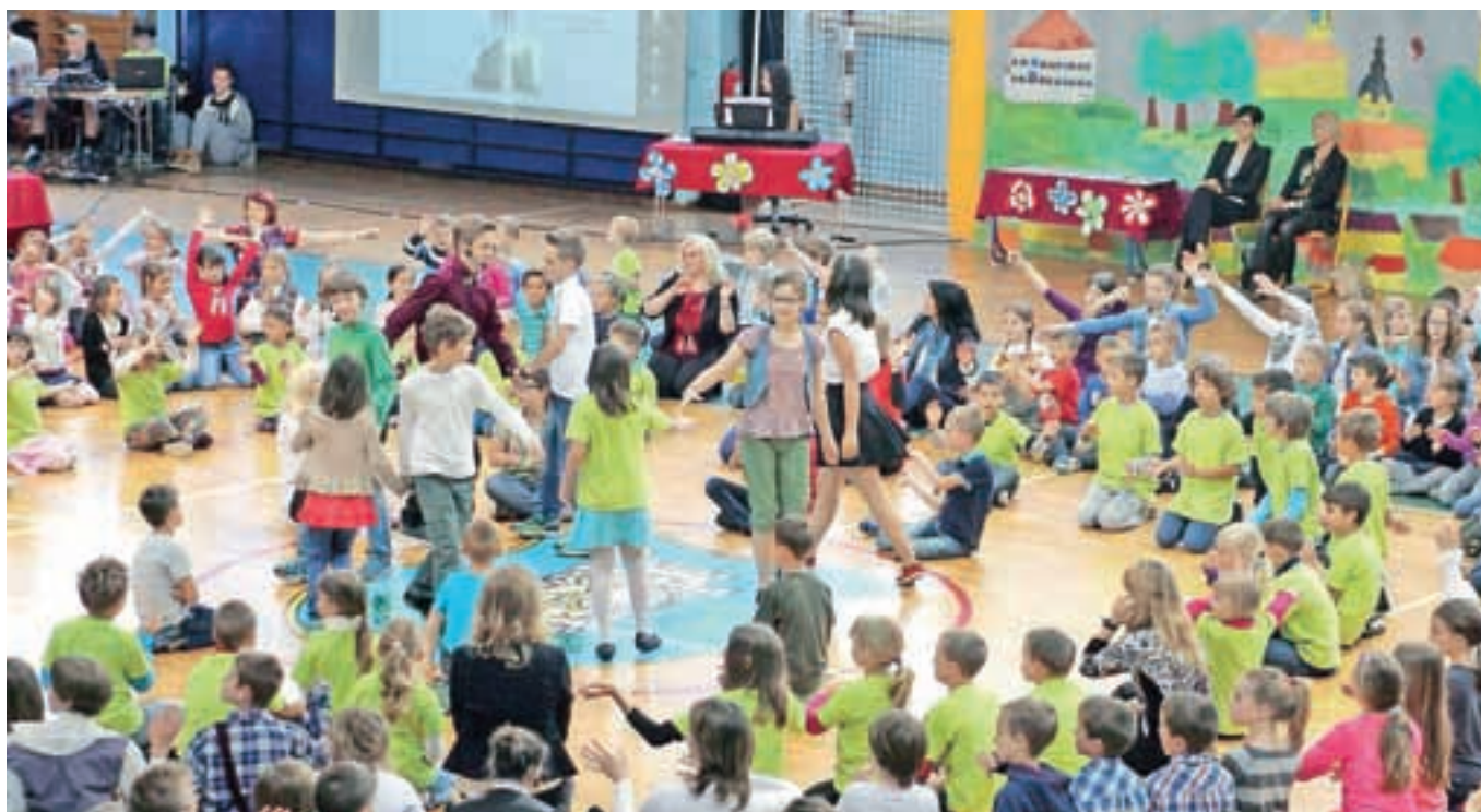
Učenci podružničnih šol iz Nevelj, Mekinj, Tunjic in Vranje Peči so polni energije in žara predstavili svoje majhne šole, ki poleg njih bogatijo tudi kraje same.

Osnovna šola Frana Albrehta je na matični šoli in svojih podružnicah v Tunjicah, Nevljah, Mekinjah in na Vranji Peči minuli konec tedna gostila petnajsti strokovni posvet učiteljev podružničnih šol Slovenije. »Majhnost je lahko tudi prednost, če le ni v glavah,« je poudaril župan Marjan Šarec.