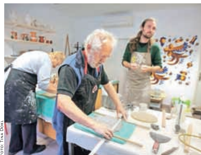
V Hiši keramike se je že zvrstilo več ustvarjalnih delavnic; nedavna je bila namenjena izdelavi posod za bonsaje.

In tako kot on svoje znanje nesebično predaja drugim keramikom, tudi člani KUD Hiša keramike – zakaj pa ne majolka? svoje znanje predajajo vsem, ki jih zanima keramika. Pri svojem delu so si zadali ohraniti kamniško keramiko, s poudarkom na ohranitvi spomina izdelave in poslikave majolik, prenašanja znanja ter razvijati sodobno keramiko. Če njihovo zgodbo kot svojo in dobro za Kamnik prepoznate tudi vi, jih pri njihovem delu pod-