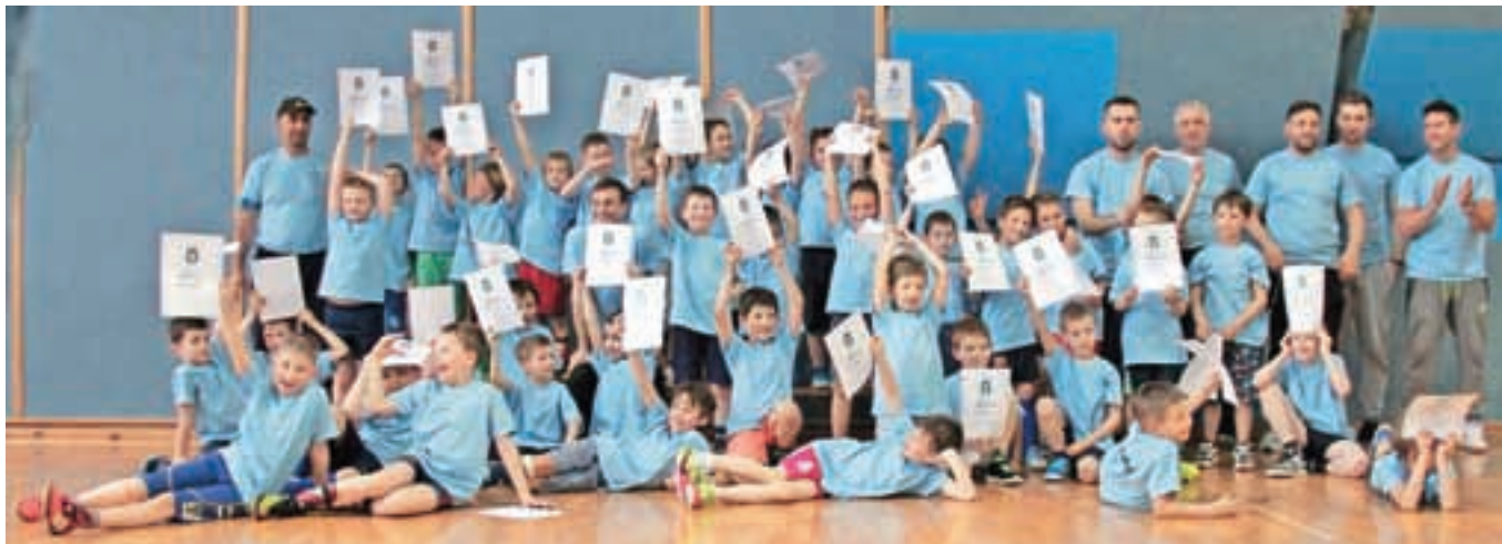
Najmlajši nogometaši so bili za svoj trud nagrajani z diplomami.

trud nagrajani z diplomami. Na koncu je bilo največje zadovoljstvo, ko smo skozi vse prireditev opazovali nasmejane in igrive otroke, zato se bomo v Otroški nogometni šoli in Nogometnem klubu Kamnik zavzemali za še več tovrstnih prireditev za nabodbe nogometaše.