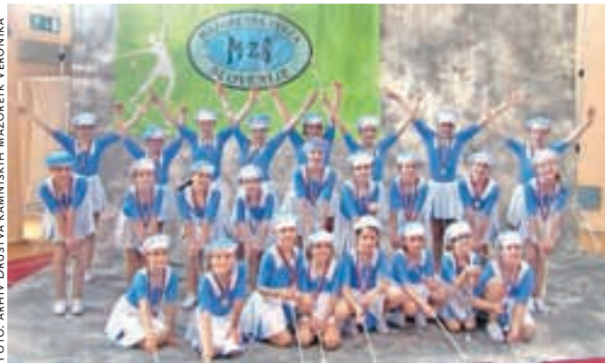
Kamniške mažoretke na državnem prvenstvu

Kamniške mažoretke so sredi maja uspešno nastopile na državnem prvenstvu, čez nekaj dni pa bodo s slavnostno prireditvijo obeležile že dvajsetletnico svojega delovanja.