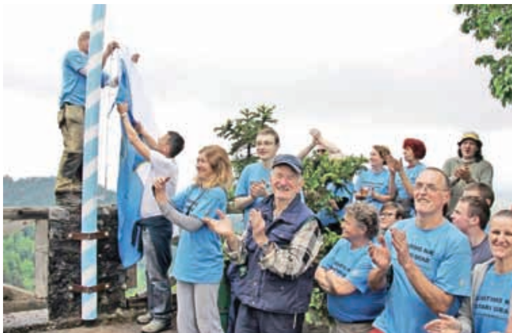
Boljše čase na Starem gradu naj bi napovedala občinska zastava, ki so jo zbrani pospremili z navdušenjem.

Iz stavbe so odnesli za štiri zvrhano polne velike zabojnike in dva tovrnjaka ali kar okoli štirideset kubičnih metrov kosovnih odpadkov in najrazličnejših drugih smeti. Z motornimi žagami, kosami in drugim orodjem so posekali grmovje, pokosili travo – tudi vzdolž ceste – objekt so v celoti pometli in pomili, in čeprav občino zdaj čaka kar nekaj nujnih vzdrževalnih del, ima grad že