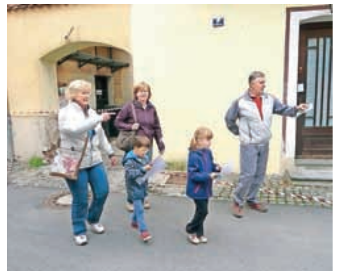
Tekmovanja so se udeležile tudi cele družine.