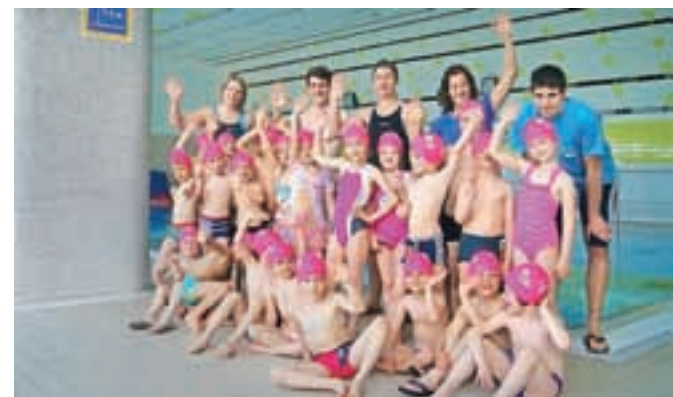
Otroci iz Vrta Zarja z vaditelji Plavalnega kluba Kamnik