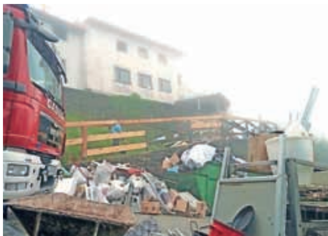
Objekt na Starem gradu je čistejši za okoli štirideset kubičnih metrov smeti.