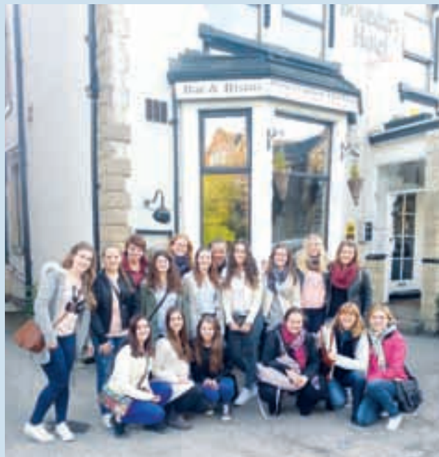
Bodoče kamniške vzgojiteljice so uživale pri delu v angleških vrtcih

Dijakinje so povedale: »Za nas je bilo to nekaj čisto novega, nismo vedele, v kaj se podajamo. Na koncu nobeni ni žal, da smo se prijave. Bila je neprecenljiva izkušnja, saj smo pridobile nova znanja, ki jih bomo lahko uporabljale kot bodoče vzgojiteljice. Opazile smo veliko razlik med slovenskimi in tujimi vrtci in šolami, nekatere dobre, nekatere slabe. Tudi ljudje so bili neverjetno prijazni. Ob tej priložnosti bi se rade zahvalile vsem, ki so se potrudili in nam omogočili to nepozabno izkušnjo.«