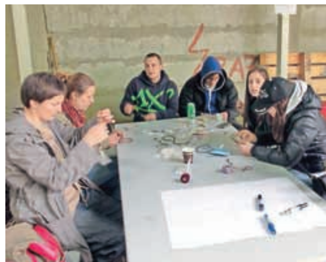
Že tradicionalni Pozdrav iz Kotla so letos mladi Kamničani začeli na KIKštarer vrtu z druženjem in delavnicami, nadaljevali v skejtparku in zaključili s koncerti v Kotlovnici.