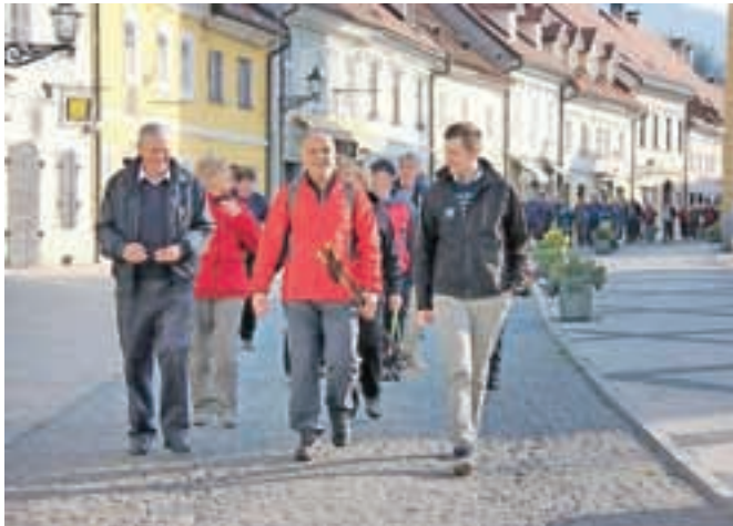
Maistrov pohod je pohodnike popeljal tudi po Šutni mimo Maistrove rojstne hiše.