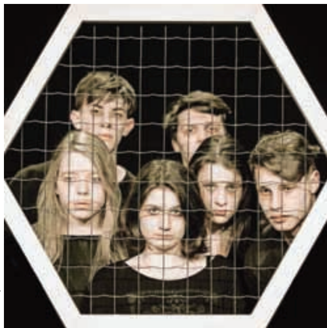
Gledališko skupino Oksimoron sestavljajo dijaki in bivši dijaki Gimnazije in srednje šole Rudolfa Maistra Kamnik.

Premiera predstave bo v petek, 8. maja, ob 20. uri, repriza pa v soboto, 9. maja, ob 20. uri, obakrat v Domu kulture Kamnik. Predstavo so podprli in omogočili Gimnazija in srednja šola Rudolfa Maistra Kamnik, Mladinski center Kotlovnica in Dom kulture Kamnik. Vljudno vabljeni, da si ogledate predstavo Panj in s tem podprete delo novonastale kamniške mladinske gledališke skupine.