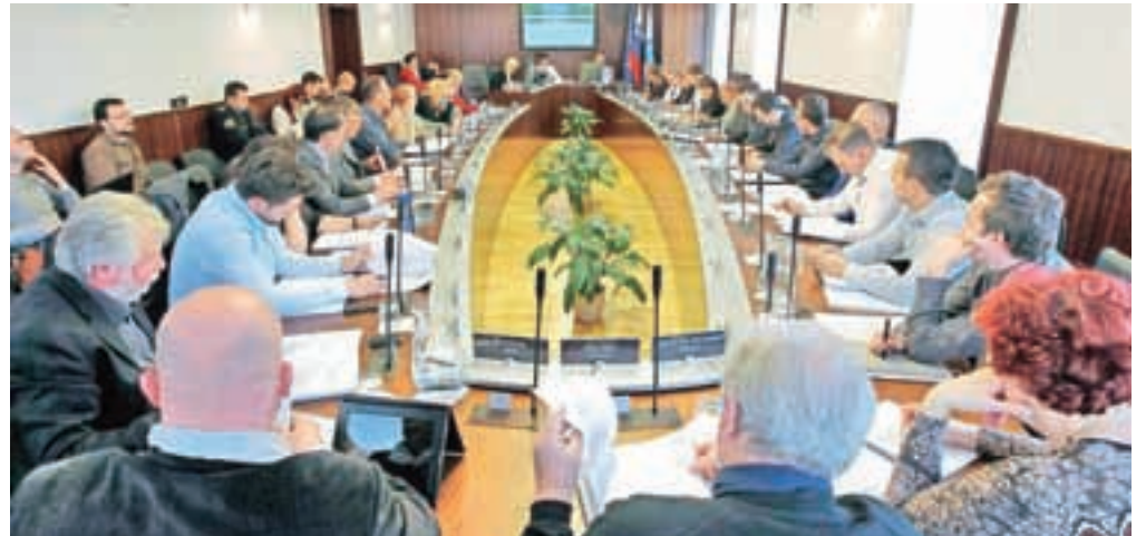
Občinski svetniki na svoji aprilski seji