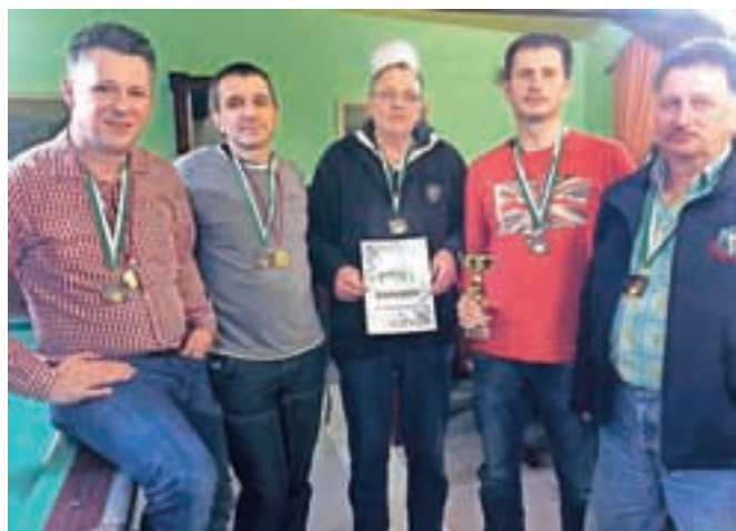
Šahisti Športnega društva Barob Šmarca so se takole razveselili priznanja za 3. mesto.