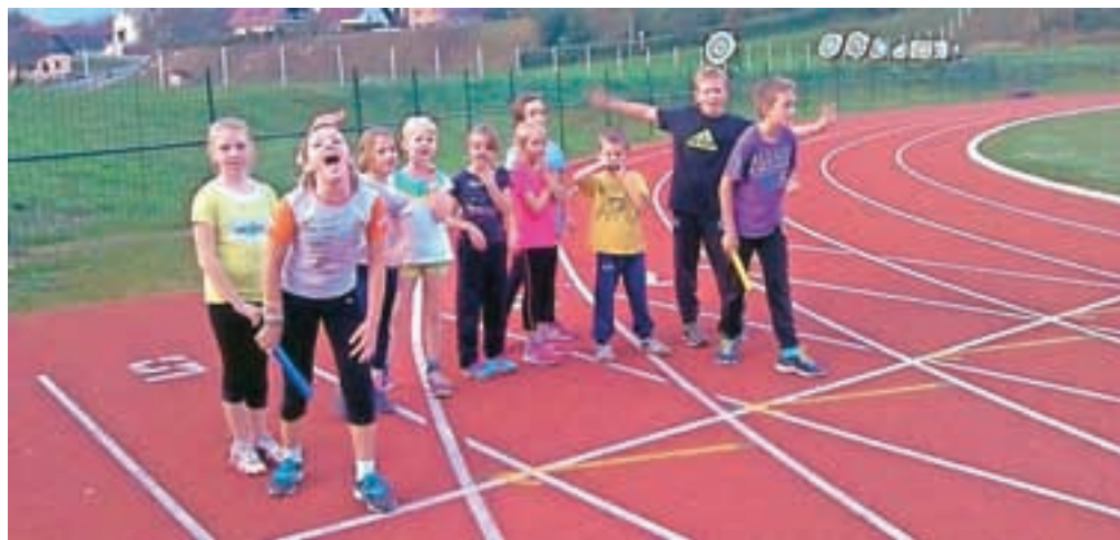
Mladi atleti na mekinjskem stadionu

Jeseni 2013 je ustanovil Atletsko društvo Kamnik in bil eden od glavnih pobudnikov in pogajalcev s Fundacijo za šport, ki je sofinancirala obnovo tekaške steze v Mekinjah. Jeseni se je tako kot predsednik društva, trener in deklica za vse začel aktivno