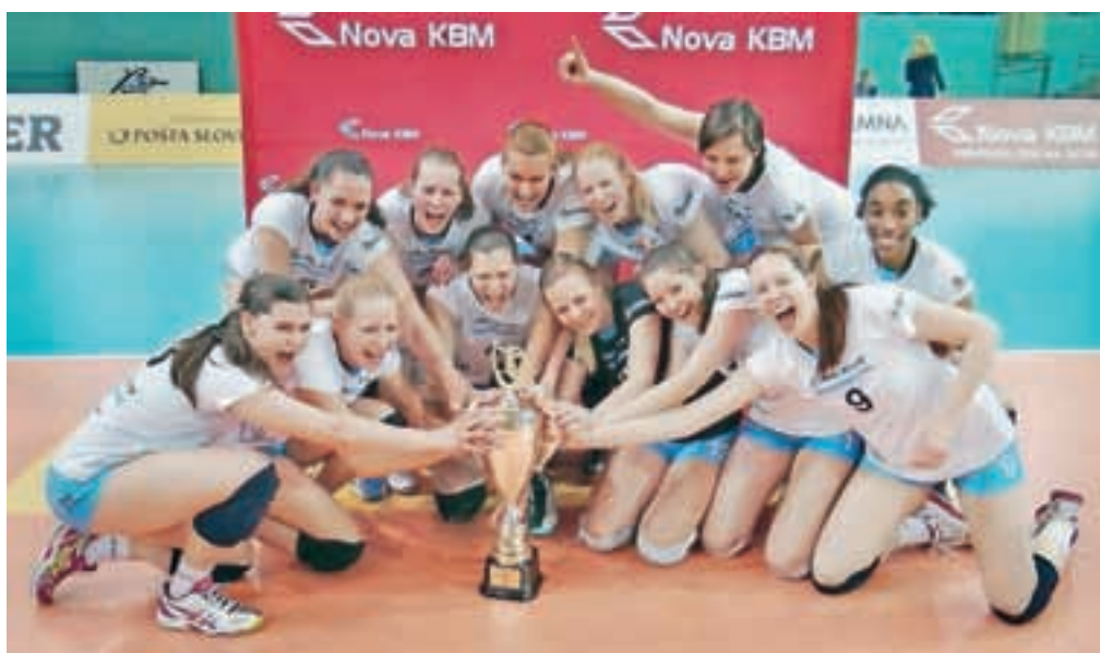
Odbojkarice Calcit Volleyballa so slovenske državne prvakinja.