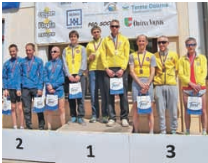
Članski ekipi KGT Papež na zmagovalnih stopničkah