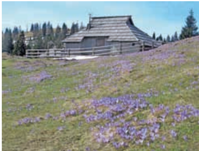
Na Dovji ravni je žafran cvetel že sredi aprila.