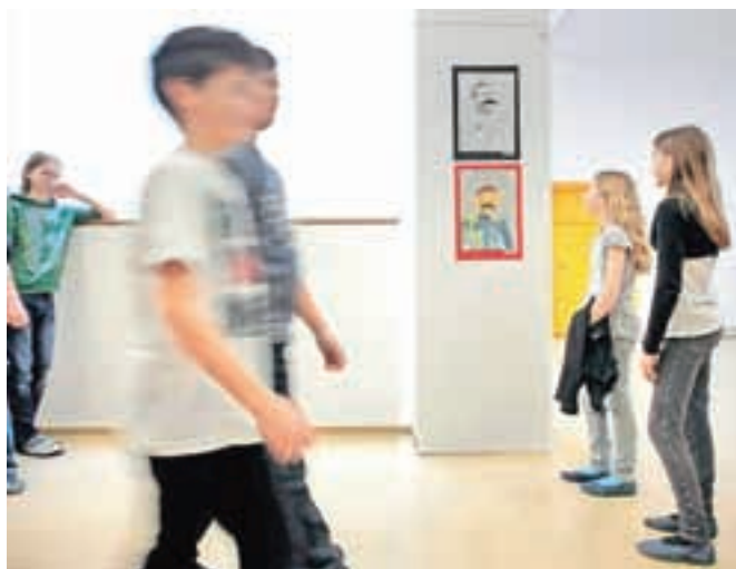
Celotno stavbo Osnovne šole Toma Brejca te dni krasijo likovna dela, ki so jih učenci vseh razredov ustvarili na temo Rudolfa Maistra.

Na odprtju razstave so mladi spomnili, da Maister, po katerem so v Kamniku nadeli ime nekaterim pomembnim objektom, ni bil le general, ampak tudi slikar in pesnik z eno največjih zasebnih knjižnih zbirk tistega časa pri nas. Tudi razstava v Osnovni šoli Toma Brejca bo na ogled še vse do konca aprila.