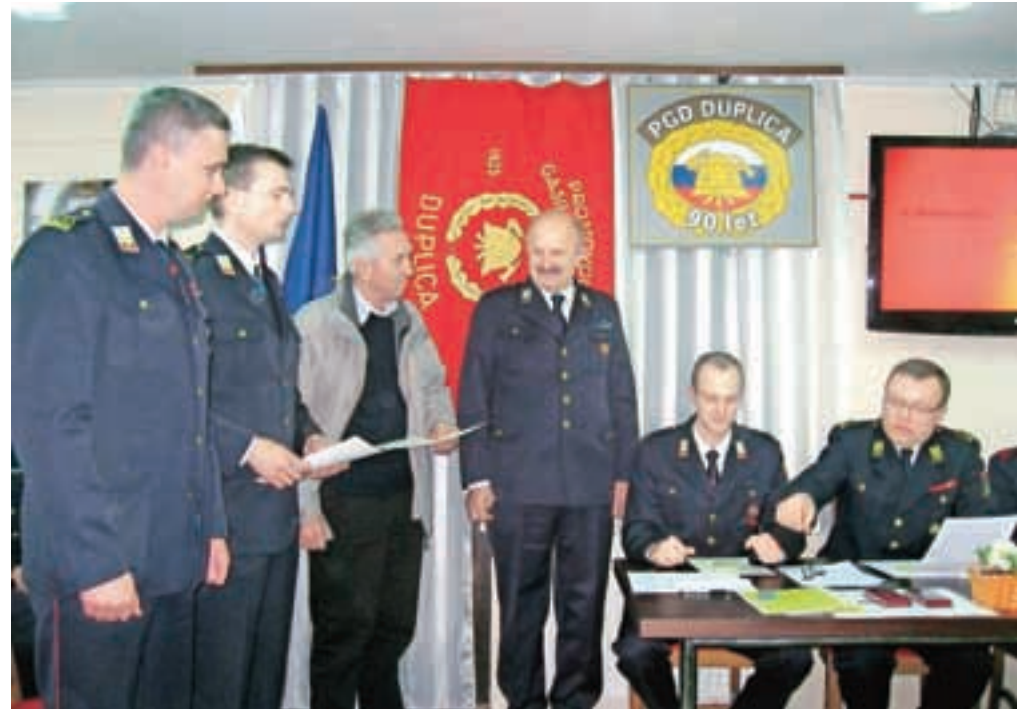
Dupliški gasilci na jubilejnem občnem zboru