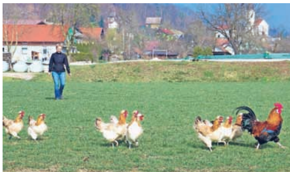
Štajerke slovijo po tem, da si veliko hrane najdejo same.

Kokoši so k hiši prišle zaradi jajc. Jajca štajerskih kokoši imajo svetlo in krhko lupino, zato so tudi zelo primerne za lepe pisane velikonočne pirhe. »Štajerke sicer ne