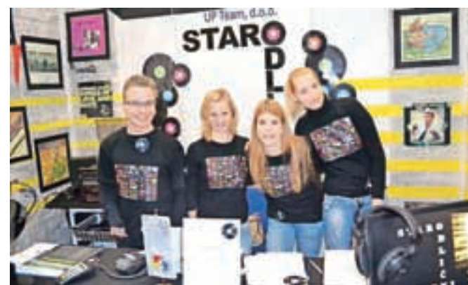
Dijaki CIRIUS-a so na sejmu predstavili inovativen način komisijske prodaje starih vinilnih plošč.