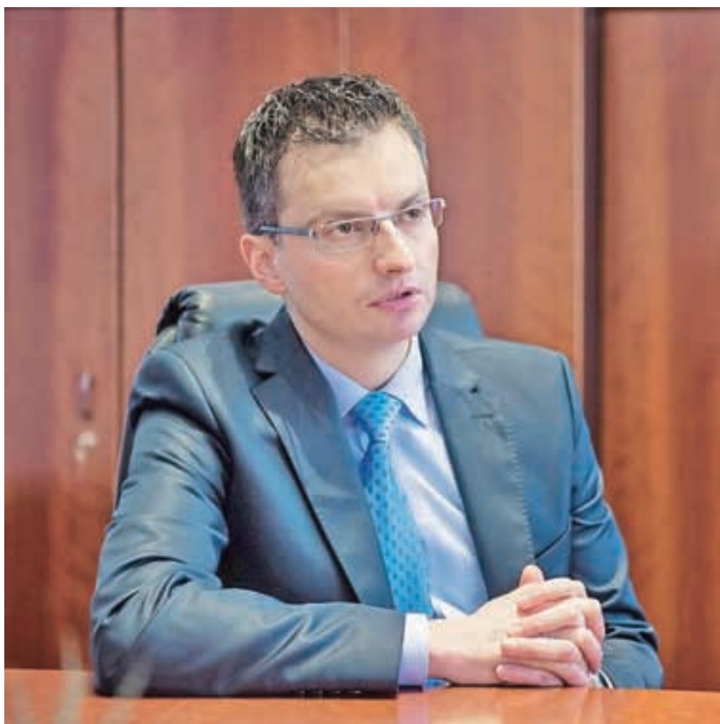
Župan Marjan Šarc

Prav tako še vedno ne vemo, kako visok bo delež tega sofinanciranja in pod katero finančno perspektivo nas bodo sploh uvrstili – staro ali novo. Niti država nima teh odgovorov, čeprav se ekipa na ministrstvu zelo trudi, a trenutno žal ne vemo, kako se bodo ti projekti odvijali. Vsi smo žrtve menjavanja vlad, zaradi česar je tudi prišlo do vseh teh zastojev. Mi smo z gradnjo začeli, vso potrebno dokumentacijo