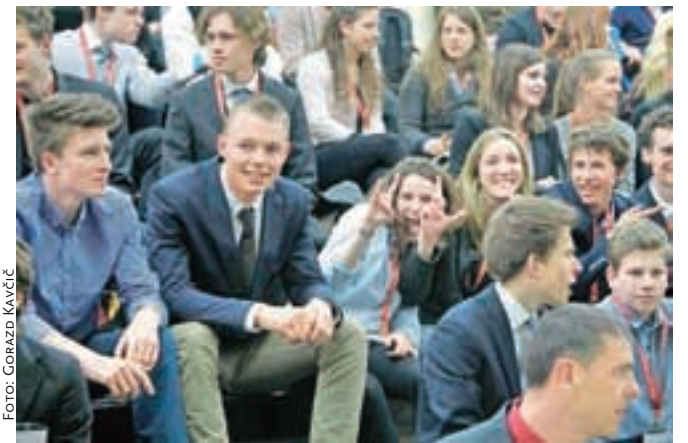
Mladi so YPAC vzeli za druženje in zabavo, predvsem pa za resno delo, debate in oblikovanje predlogov, s katerimi želijo pomagati pri reševanju problemov alpskih držav.