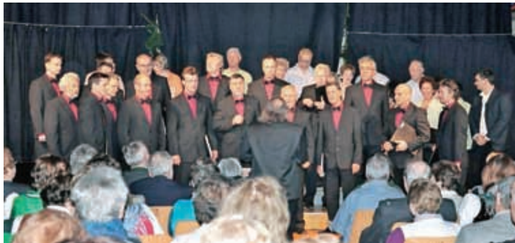
Skupni nastop pevcev Prvega slovenskega pevskega društva Lira in zbora iz Trofaiacha