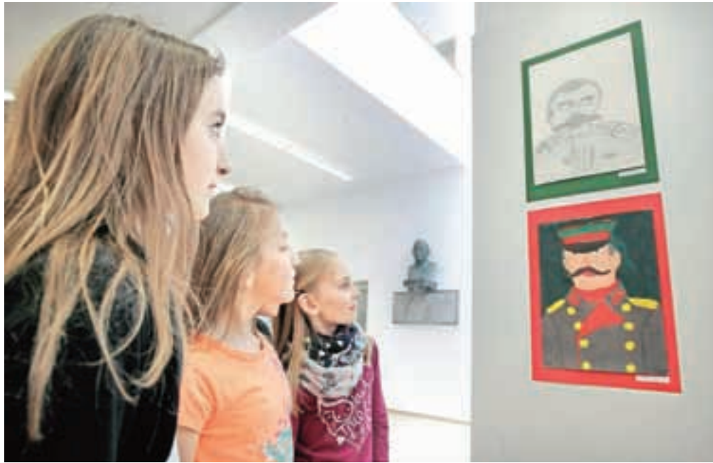
Tudi mladi se zavedajo pomena v Kamniku rojenega Rudolfa Maistra, ki pa ni bil le general in borec za severno mejo, ampak tudi pesnik.

Rudolfa Maistra so se letos spomnili celo v Termah Snovik, kjer so pred dnevi predstavili svoj zbornik Termalna voda – vir življenja in razvoja ter odprli priložnostno razstavo z naslovom Delo Rudolfa Maistra. Generalova dejanja so sicer precej neposrečeno primerjali s svojim delom v zadnjih