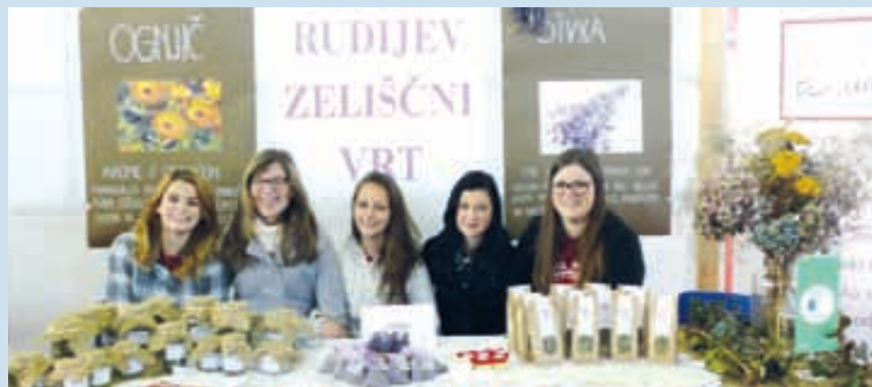
Kopica zdravja s šolskega eko vrtička na sejmu ALTERMED. Dijaki 1. letnika smeri ekonomski tehnik so z mentoricama na svoji stojnici razstavili zelišča s šolskega eko vrta, domač Rudijev zeliščni čaj, vrečke dišeče sivke in ognjičevno mazilo. Slednje je pošlo v trenutku, tako da že načrtujejo še dodatne zeliščne gredice.

Napovedujemo plešočo pomlad: maturantski ples in Prvi Majstrov pomladni ples v rdečem.