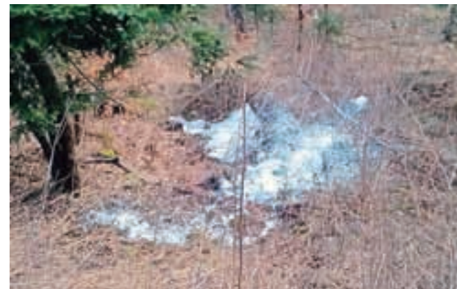
Takole so neznanci v naravo odvrkli okoli sto napol praznih posod z barvo.

Kranjski Rak, Zakal – Boris Štupar nam je pred dnevi poslal fotografije iz gozda pod cesto Podlom–Kranjski rak–Luče, ki jo je domnevno 17. marca zaznamoval objesten pleskar. In to prav ob 130-letnici Luške ceste. »Vasi na mejah občin so pogosto odmaknjene od interesov. Zaradi tega tudi kakšnega praznovanja idejnih začetkov cestne povezave med Kamnikom in Lučami ni bilo. Je pa zato nek malar vzel stvari v svoje roke in v gozd pod državno cesto zmetal lepo število hobukov. V nekaterih je bilo še kar precej barve.« je zapisal Boris Štupar, ki je o dogodku obvestil tudi občino. Občinski prekrškovni organ je ugotovil, da je na strmem pobočju okoli petdeset pločevink barve, s