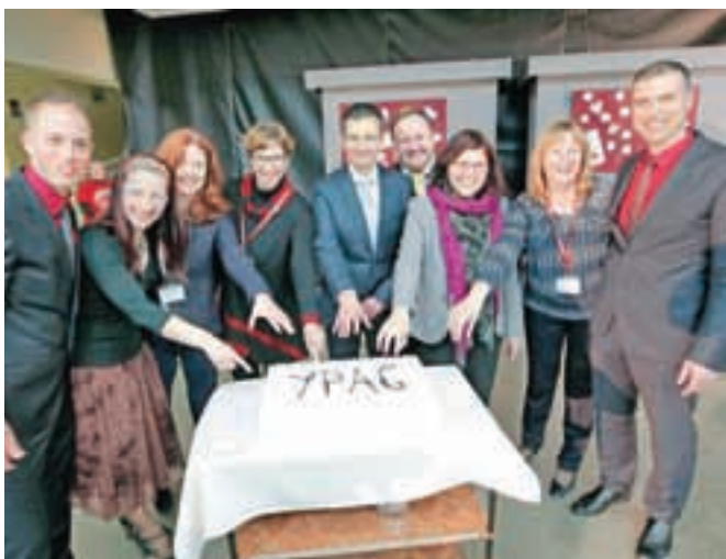
Organizatorji iz GSŠRM so največji mednarodni dogodek tega šolskega leta izpeljali tako, kot so si zamislili.

YPAC deluje kot simulacija pravega parlamenta in dijaki omogoča razpravljati in predlagati trajnostne rešitve za aktualne probleme v alpskih regijah. Letošnja tema so bile ekosistemske storitve v času podnebnih sprememb, znotraj katere so se štirje odbori podrobneje spoznali z naslednjimi podtemami: tla, proizvodnja hrane in asimilacija odpadkov, goz-