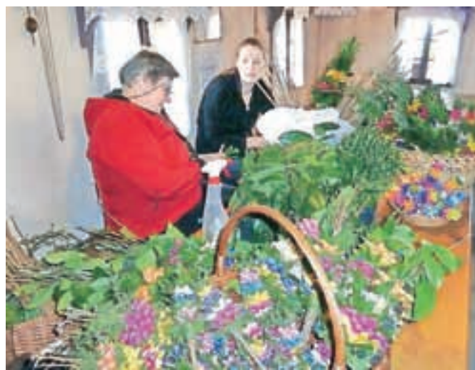
V Budnarjevi domačiji so v nedeljo znova poskrbeli za velikonočno vzdušje.