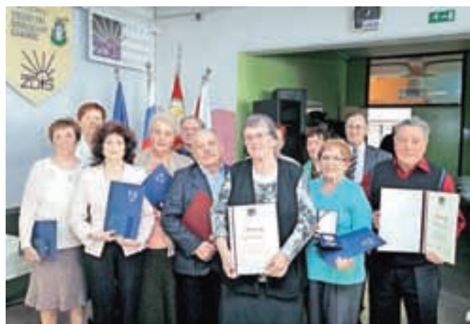
Prizadevnim članicam in članom so podelili priznanja Medobčinskega društva invalidov Kamnik in Zveze delovnih invalidov Slovenije.