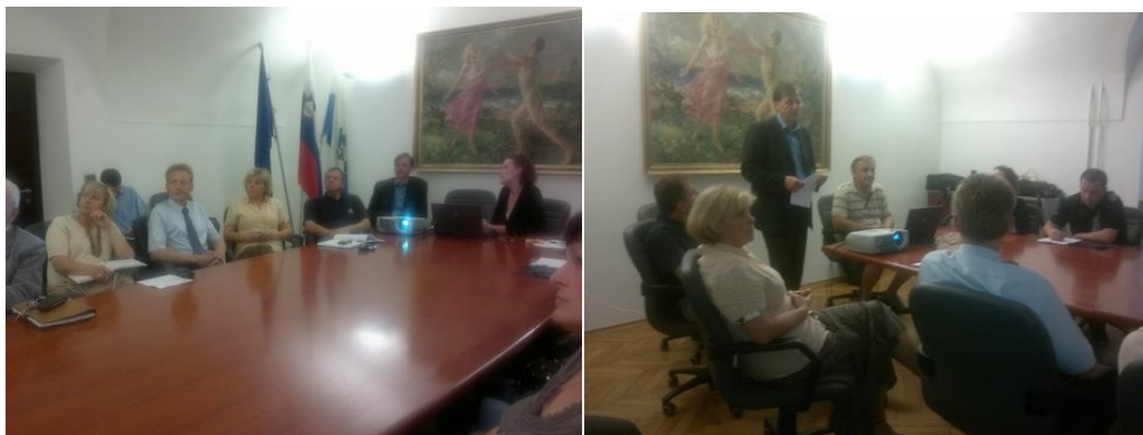
Strokovna služba Mrežnega podjetniškega inkubatorja Savinjske regije je predstavila podporno okolje za podjetništvo v Republiki Sloveniji in podporno okolje za podjetništvo v tujini

Na delavnici smo udeležence seznanili s podpornim okoljem v Sloveniji, jim podrobneje predstavili podjetniške inkubatorje, univerzitetne inkubatorje in tehnološke parke ter njihovo delovanje. Prav tako smo predstavili delovanje podobnih institucij v tujini ter zgodovinski prerez nastanka inkubatorjev v tujini in v Sloveniji, povezavo z Lizbonsko strategijo. Lizbonska strategija je strategija pospeševanja konkurenčnosti evropskega gospodarstva in izhodišče nacionalnih strategij pospeševanja konkurenčnosti in podjetništva.