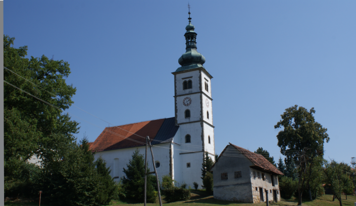
Cerkev na Polenšaku

Ob dvorcu je bila zasnovana obsežna parkovna zasnova, ki je bila po svojih razsežnostih in oblikovalnem izrazu edina in edinstvena pri nas. Razkošna baročna zasnova dvorca z vrtom se začne s kipom Brezmadežne, skozi lipov drevored vodi do predvrta, ki je zaščiten z ograjo z rustificiranimi ograjnimi slopi, okrašenimi vazami in baročnimi plastikami. Skozi prostorno vežo dvorca se je vrtni prostor prelil na drugo stran na prostrano dvorišče, kjer stoji Neptunov vodnjak, okrog so plastike antičnih mislecev, ki predstavljajo modrost in širino človekovega duha, v nasprotju z njimi pa dvanajst pritlikavcev prikazuje duševno in telesno pohabljenost. Septembra 2002 je bil dvorec izpraznjen in še čaka na svojo namembnost.