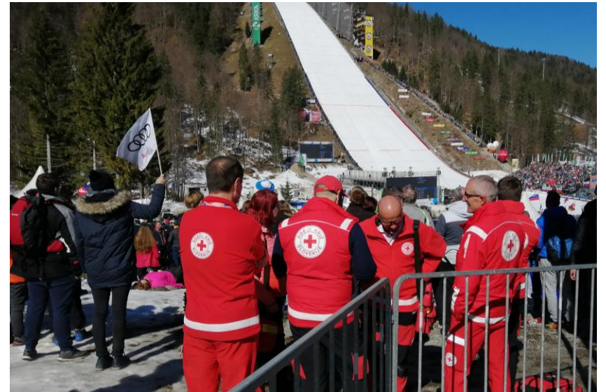
Skrb za varnost in zdravje v Planici (marec 2015)

Rdeči križ Slovenije lahko ob različnih dogodkih pozove prostovoljce bolničarje, da se odzovejo na pomoč. V primeru odziva so prostovoljci deležni nadomestila za prevoz, prehrano in redundacijo osebnega dohodka. Prostovoljec dobi tudi uniformo (oblačilo) RKS in osebno opremo, ki jo uporablja v času aktivnosti.