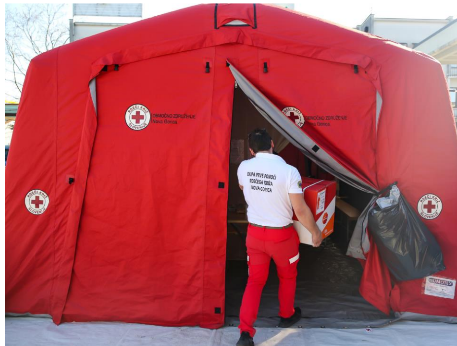
Na mejnem prehodu (pomlad 2020)

Uprava Republike Slovenije za zaščito in reševanje organizira v dogovoru z Rdečim križem Slovenije in drugimi nevladnimi organizacijami ter občinami do 200 ekip za prvo pomoč, ki lahko delujejo na območju celotne države. Območna združenja Rdečega križa Slovenije v sodelovanju z občinami ustanovijo najmanj eno ekipo na 5.000–10.000 prebivalcev in na vsakih nadaljnjih 10.000 prebivalcev še eno ekipo. Ekipe so poimensko zapisane v evidenci Uprave RS za zaščito in reševanje in se jih po potrebi lahko aktivira.