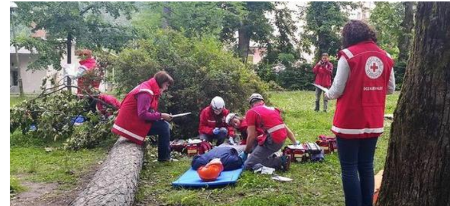
Regijsko preverjanje znanja usposobljenosti PP ekip (Postojna, junij 2015)