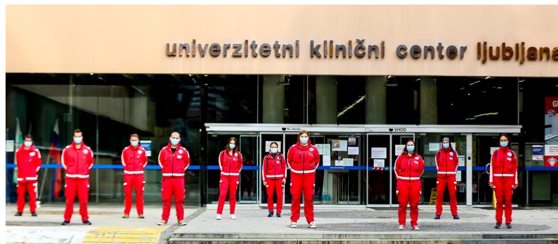
Vpoklic bolničarjev na pomoč v UKC Ljubljana (oktober 2020)