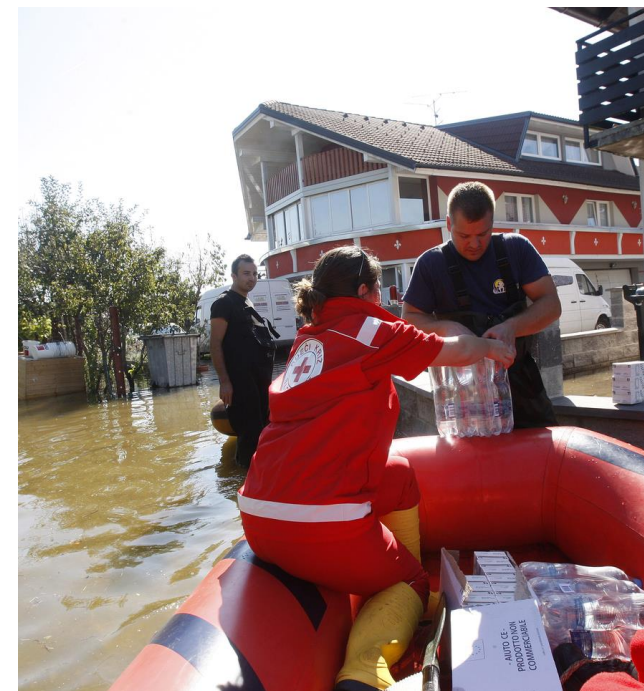
Ob poplavih na ljubljanskem Barju (november 2014)