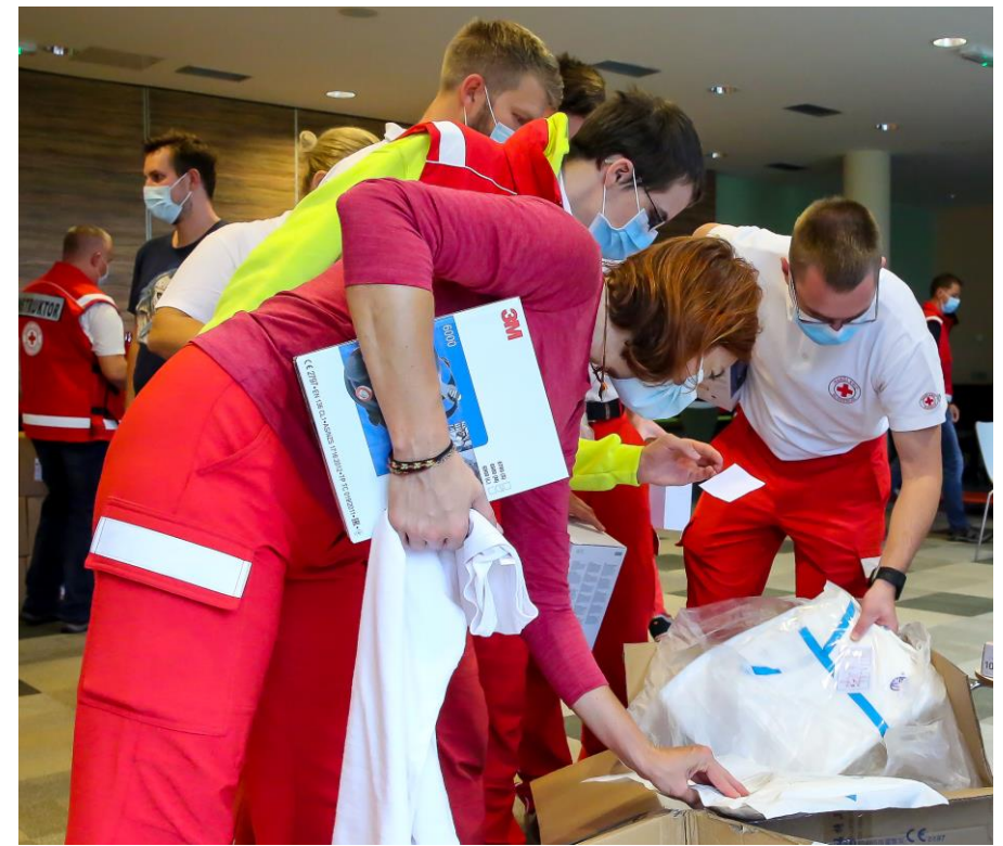
Dodatno usposabljanje za delovanje v covid-19 razmerah (Debeli rtič, september 2020)

Stroške usposabljanja in prehrane ter nadomestila za plače in potne stroške za udeležence iz ekip prve pomoči, ki so namenjene delovanju na vsem območju države, krije Uprava RS za zaščito in reševanje.