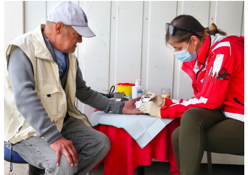
Skrb za zdravje brezdomcev v zavetišču Koper